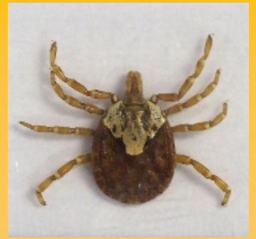
タカサゴキララマダニ