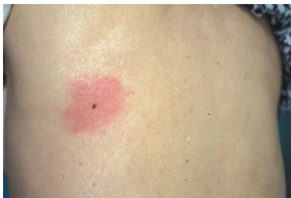
フタトゲチマダニ