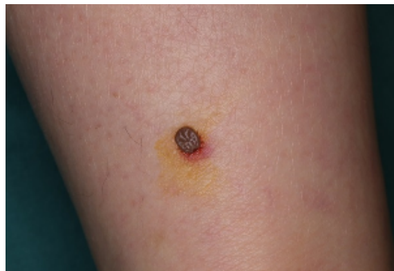
タカサゴキラマダニ