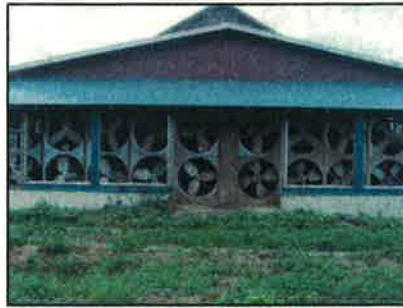
↑牛舎壁面の換気扇

○分娩間隔の短縮 19年 14.5ヶ月 → 20年 13.9ヶ月 0.6ヶ月短縮