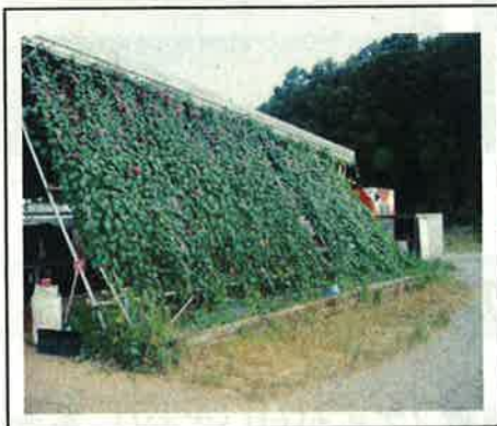
ネットに植物を這わせる(兵庫県)