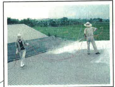
石灰の吹きつけ(宮崎県)