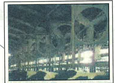
換気扇による送風(福井県)