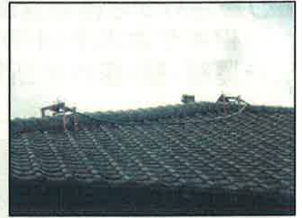
↑牛舎屋根に設置したスプリンクラー