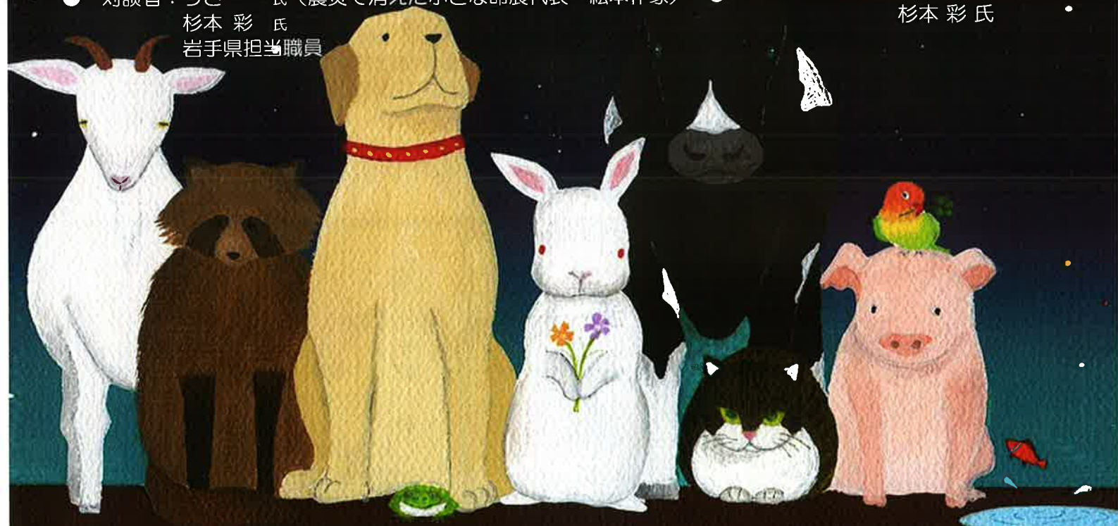
（画）同じ星空を見た夜/うさ