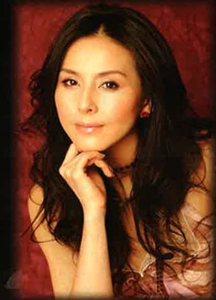
杉本 彩 氏